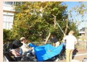
秋の一コマ 柿の収穫

楽しいことは楽しく、苦しいことも楽しくなるように(辛くないように)過ごしていきましょう!