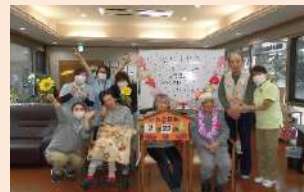
利用者さんの誕生を祝う スタッフは女子率高いです(^^)