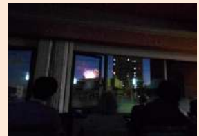
夏は福井花火が室内から観れます(今年は観たいですね)