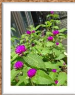
【いちごライフ】 ・サツマイモ ・アサガオ ・ひまわり ・千日草